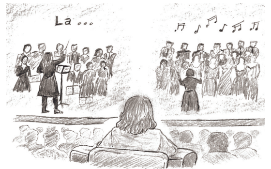
Dessin de Jérôme

« Quand les mots s'arrêtent, la musique commence » disait Jean-Claude Casadesus, encore chef d'orchestre aujourd'hui à 90 ans.