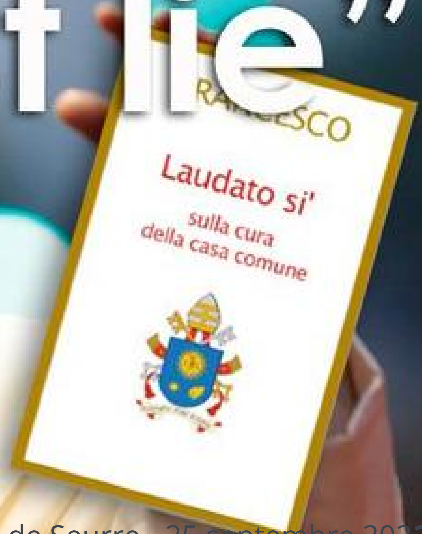
Fête de la Création à Tichey - Paroisse de Seurre - 25 septembre 2022